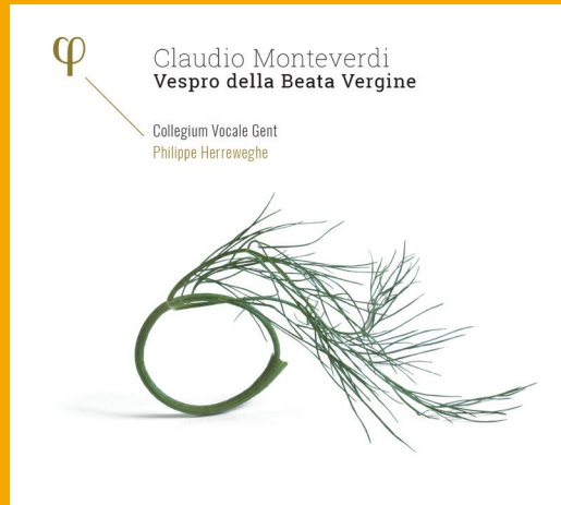
Claudio Monteverdi Vespro della Beata Vergine Collegium Vocale Gent, Philippe Herreweghe