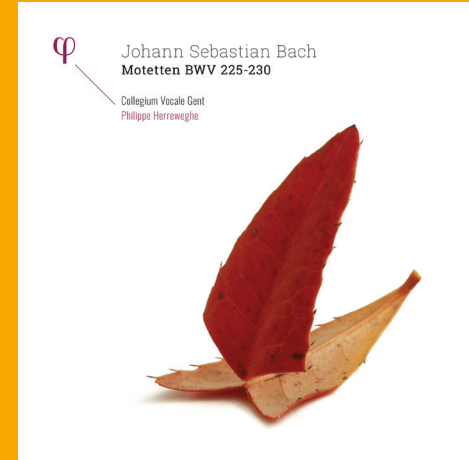
Johann Sebastian Bach Motetten BWV 225–230 Collegium Vocale Gent, Philippe Herreweghe DOUBLE LP