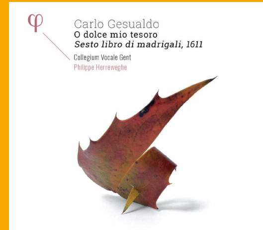
Carlo Gesualdo O dolce mio tesoro Collegium Vocale Gent, Philippe Herreweghe