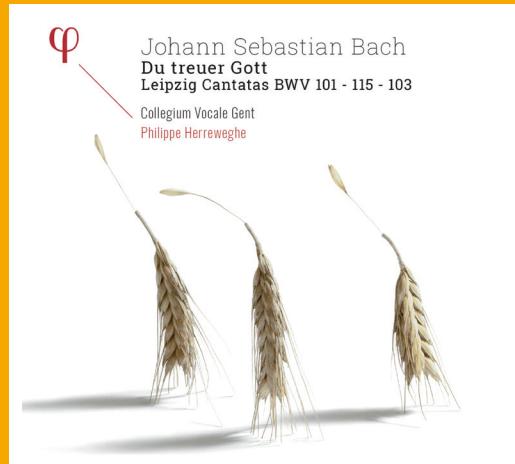
Johann Sebastian Bach Du treuer Gott Leipzig Cantatas BWV 101 – 103 – 115 Collegium Vocale Gent, Philippe Herreweghe